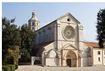
Abbazia di Fossanova