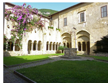
Abbazia di Valvisciolo