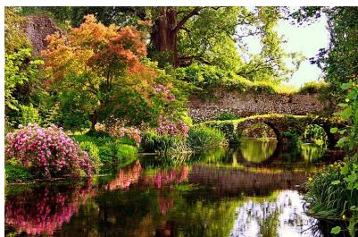
Giardino di Ninfa